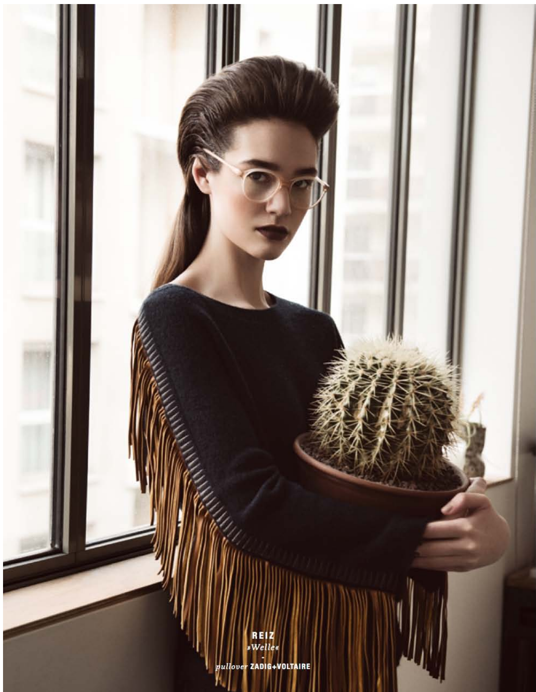
REIZ »Welle« - pullover ZADIG+VOLTAIRE