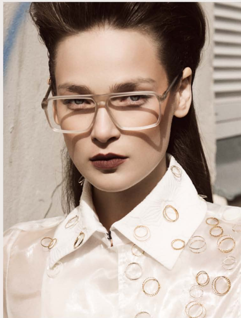
REIZ »Vector« - coat GUY LAROCHE